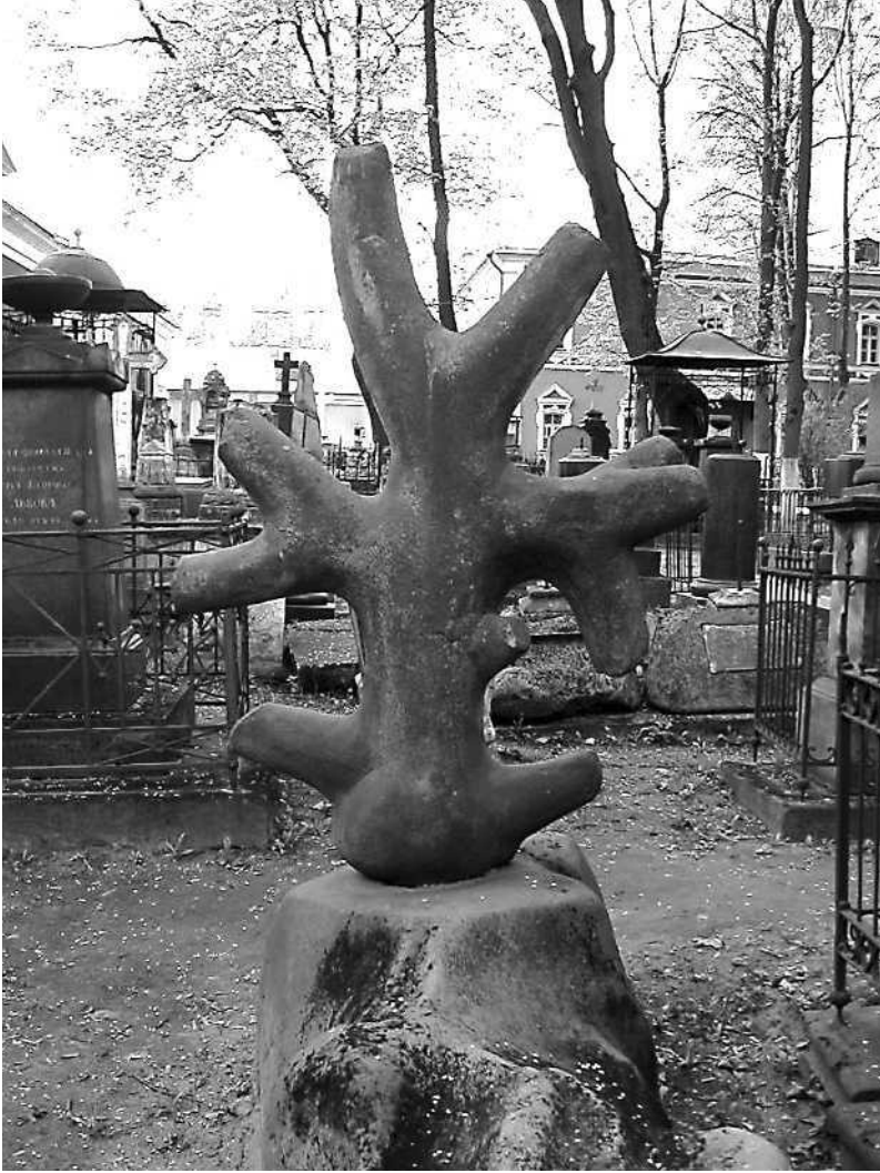
Monument au lieutenant Baskakov

de terre, dont l'aspect est celui d'une croix branchue : symbole maçonnique à la mémoire du lieutenant Baskakov, mort en 1794. Aucune information complémentaire, hélas.