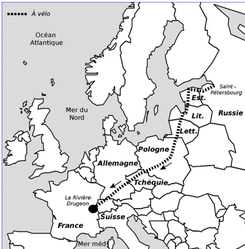
De la Russie au Jura